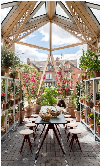
Lichtdurchflutete Atmosphäre im Innenraum