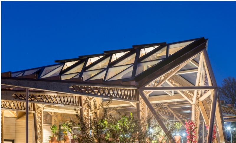
Dachkonstruktion aus Holz