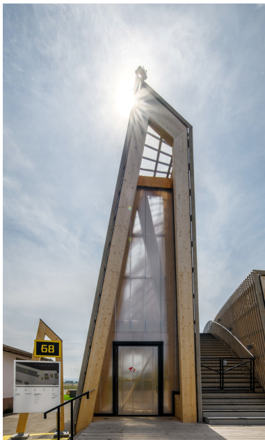
Eingangsbereich in der Free Form-Hülle