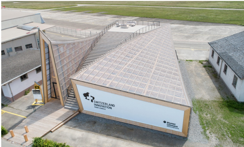
Leuchtturmobjekt für den Innovationspark