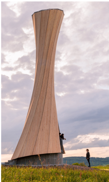
Eine Lärchenfassade umhüllt den Turm